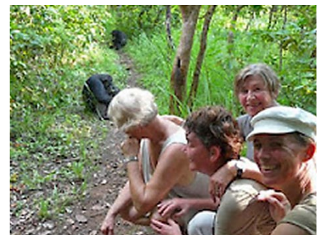
Ook een bezoek aan de chimpansees in het Gombe Stream National Park.