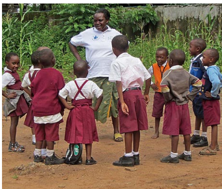
Gymles op Perfectus Nursery School.